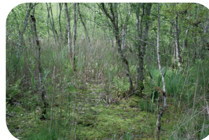
Boulaie tourbeuse de plaine

Cet habitat très rare est une zone humide boisée dont la végétation caractéristique est constituée principalement de bouleaux, d'aulnes et de sphaignes (genre de mousses). Le plus souvent de faible superficie, cet habitat s'exprime sur des sols tourbeux, acides, pauvres en éléments nutritifs et bien alimentés en eau.