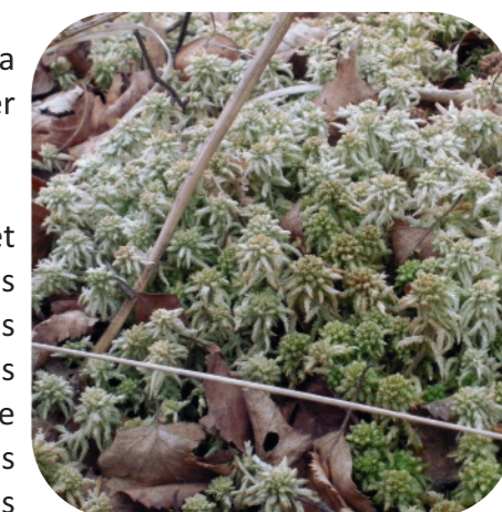
Sphaignes ( Sphagnum sp. )

L'habitat de boulaie tourbeuse est présent sur le site Natura 2000 des Étangs oligotrophes à littorales ainsi que sur celui de la vallée du Branlin. Ce dernier possède par ailleurs le plus bel exemple de Bourgogne.