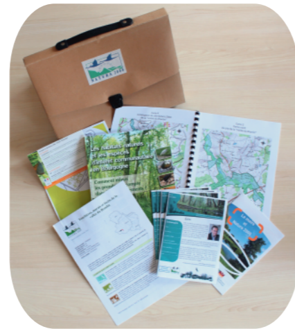
Contenu du kit

A l'heure actuelle, 7 conseils municipaux des 9 communes concernées ont pu être rencontrés.