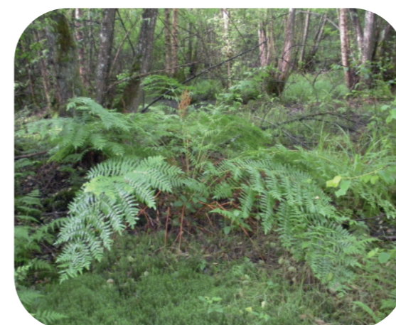
Osmonde royale ( Osmunda regalis )

Chaque entité de boulaie tourbeuse peut se révéler très différente des autres et la compréhension de leurs fonctionnements s'avère souvent complexe à appréhender même si très intéressant et indispensable à leur préservation.