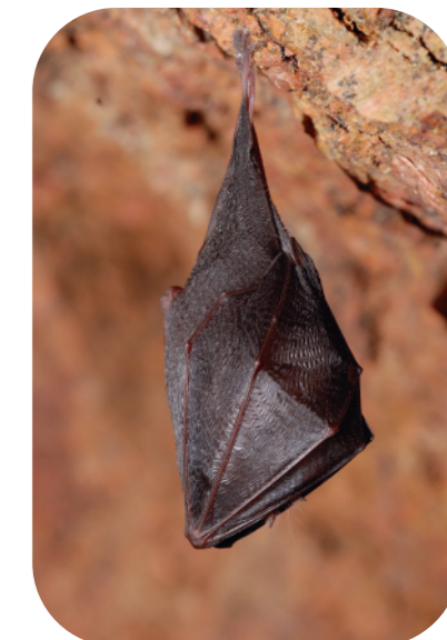
Petit rhinolophe en hibernation