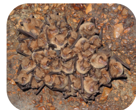
Colonie de mise bas de murins à oreilles échanquées