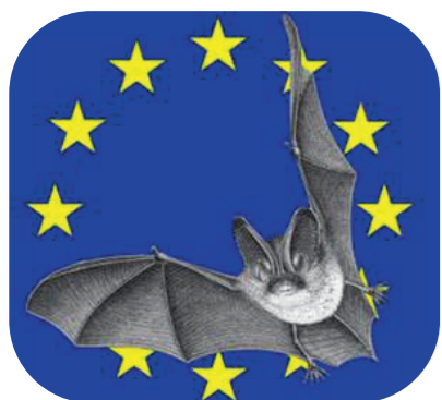
Logo de la nuit de la chauve-souris