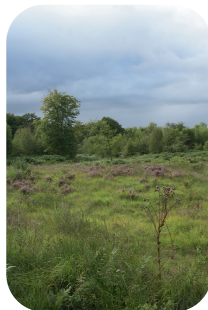
Lande et prairie humides

Le site possède également plusieurs espèces protégées et/ou d'intérêt communautaire comme l'Ecaille chinée ( Euplagia quadripunctaria ) ou la Gentiane Pneumonanthe ( Gentiana pneumonanthe ).