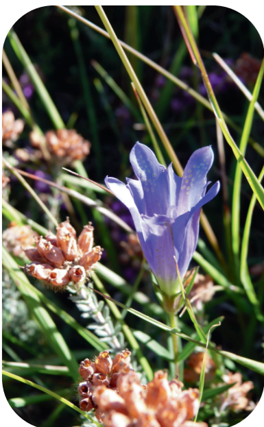
Gentiane pneumonanthe ( Gentiana pneumonanthe )